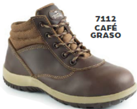
7112 CAFÉ GRASO